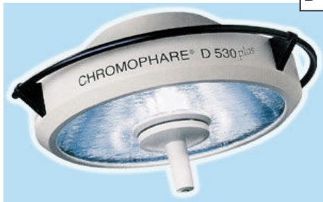
D 500-D 530 plus