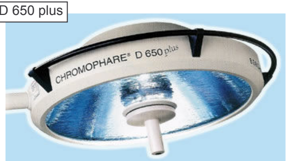
D 650 plus