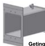
Getinge K5+ profondeur : 345 mm