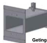
Getinge K3+ profondeur : 345 mm

Le modèle K3+ se décline maintenant en deux versions, avec le nouveau boîtier en acier inoxydable ou avec le boîtier blanc.