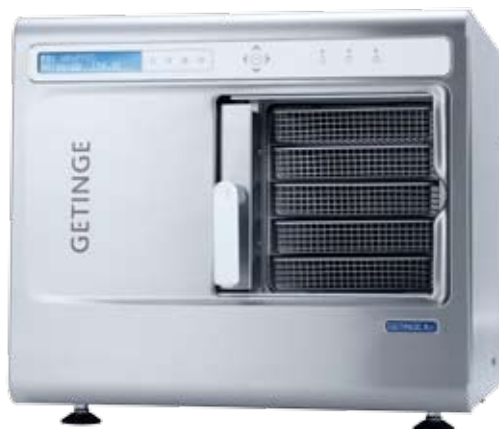
Les modèles K5+ et K7+ se déclinent en deux versions, avec le nouveau boîtier en acier inoxydable ou avec le boîtier blanc.

Voici ce que le Geringe K5+ peut stériliser en une heure :